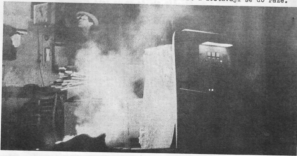
BEZ PŘETLAKOVÉ HELMY ANI RAŇU!!!

Výpary z pecí a vodního skla ve slévárenské hale tvoří téměř neproniknutelnou mlhu, v níž bloudí těžká břemena jeřábků. Takhle nějak si představuji peklo. Hlavními kameny úrazy jsou zde údajně postižená záda, vazoneurozy z vibrací a prach na plicích. Hoří v modrácích cítí možnost naplno se vyjádřit a dostávají se do ráže.